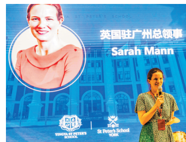
总领事在学校演讲。