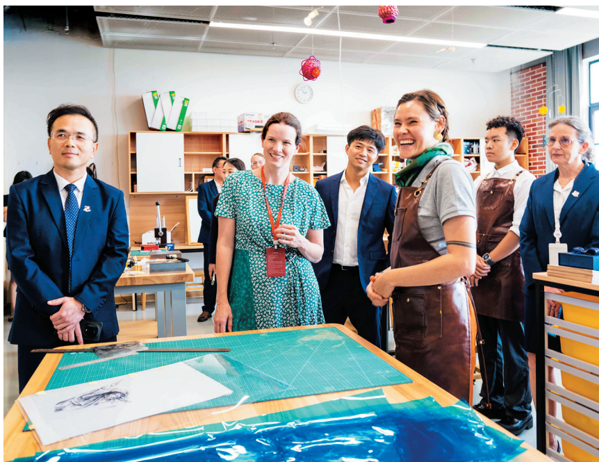
参观学校国际手工课堂。