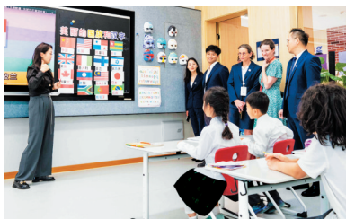
旁听小幼教地理课。