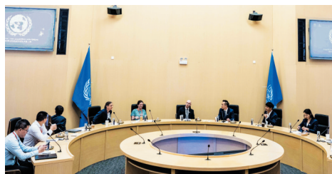
在学校模拟联合国会议厅座谈。