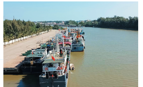
从潭门大桥上俯瞰潭门休闲码头里的渔船。记者 苏桂除 摄