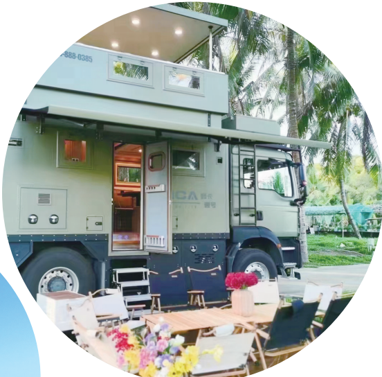
炫酷机甲房车。