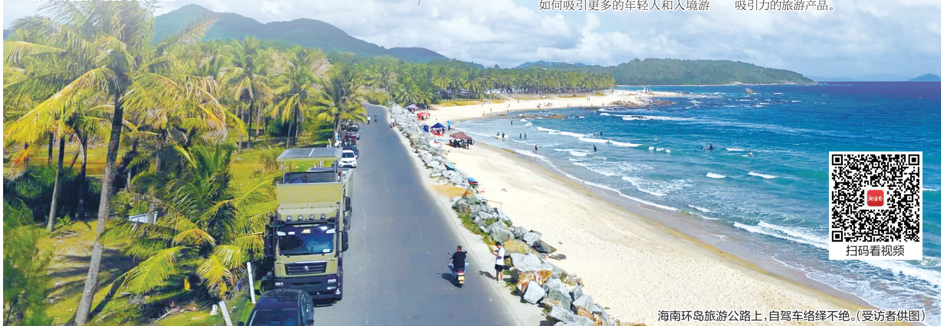
海南环岛旅游公路上,自驾车络绎不绝。