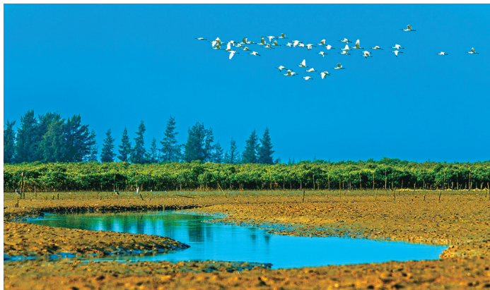
四必湾湿地上空的黑脸琵鹭。