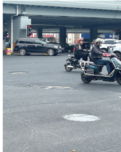
部分窨井盖低于路面3.5厘米-4厘米