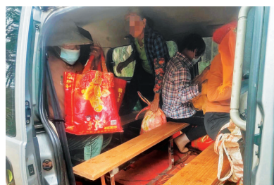
案例一面包车被查现场。