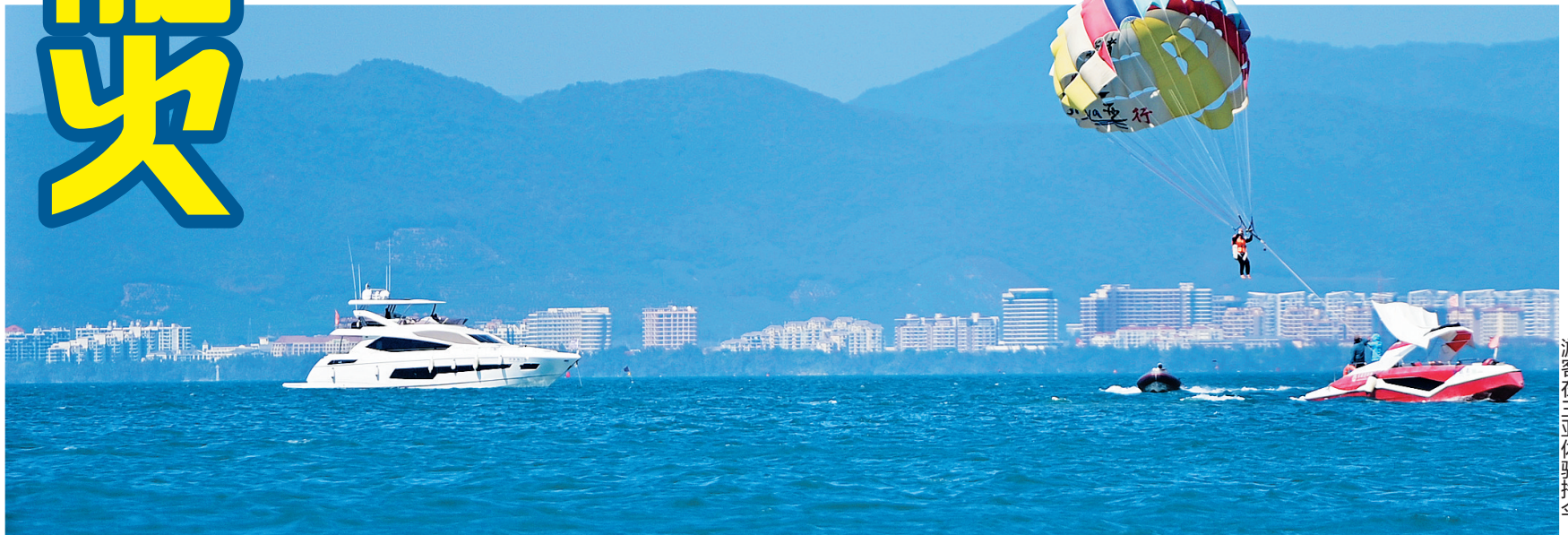
游客在三亚体验拖伞。

南国都市报1月7日讯(记者 沙晓峰 文/图)连日来,三亚游艇旅游市场持续火热——在三亚湾、情人湾等海域,密密麻麻的游艇航行海面,游客乘坐游艇出海,或观赏海景,或体验水上飞龙特色海上娱乐项目。