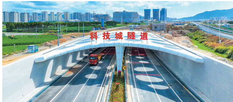
通车后车辆有序进出隧道。

南国都市报1月15日讯(记者 符彩云)15日上午10时许,随着第一辆红色汽车驶入科技城隧道,标志着环岛高速崖州湾科技城段改建工程项目实现隧道部分主体完工通车。