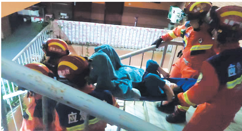
澄迈一临产孕妇羊水破裂 5名消防员抬下五楼(通讯员供图)

参与救援的消防人员介绍,当时在医护人员的指导下,他们用多功能担架将这位准妈妈平躺固定好再协力抬下楼。考虑到楼梯间距较窄,他们尽量动作平稳,紧贴墙壁留出空间。救援人员不时安抚孕妇。经过近10分钟的紧急救援,临产孕妇被顺利抬到救护车上。