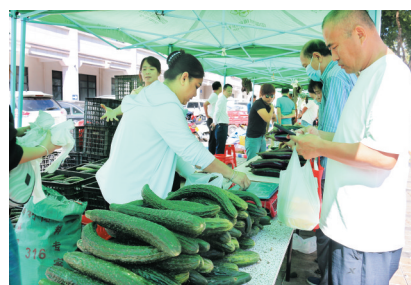
市民在“一元购”区域购买青瓜、茄子。

“都是早上采摘后立即运来的。你看,有的蔬菜叶子上还留有水珠。”三亚市供销社相关负责人介绍,消费助农活动主动与本地基地农户、蔬菜合作社进行了产销对接,拓宽农产品的销售渠道。当天,来自天涯、崖州、育才等地的62名农民,带来自产的特色农产品。