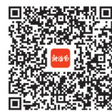
扫码看不合格电动车名单

经检验,不合格11批次,不合格率为18.3%。不合格项目为号牌安装位置、整车质量、车速限值、短路保护、尺寸限值、使用说明书、防碰撞、蓄电池防篡改、导线布线安装。