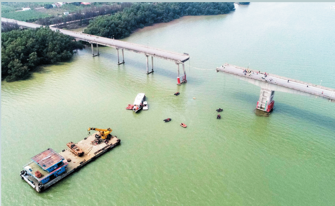
2月22日，救援人员在沥心沙大桥事故现场进行救援(无人机照片)。