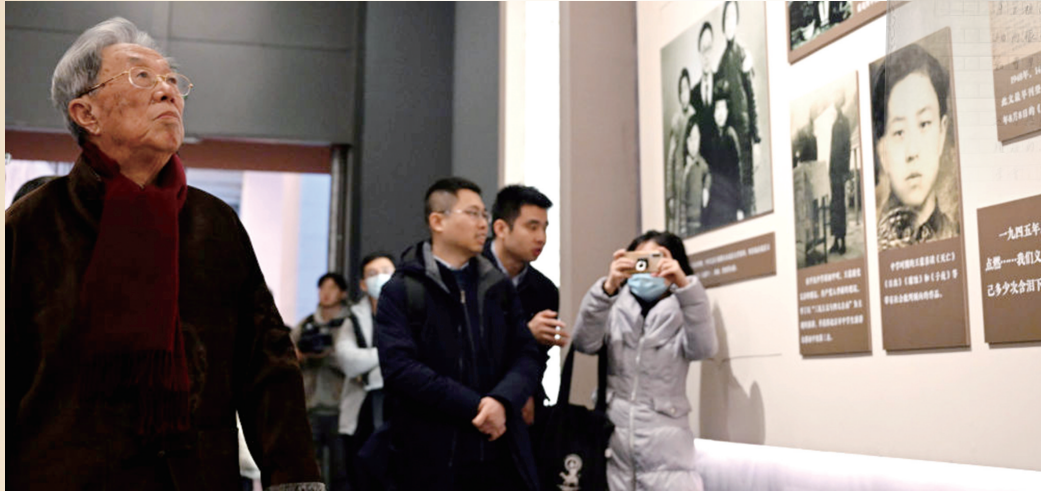
2023年12月21日，作家王蒙(左一)参观展览。新华社记者 金良快 摄

“或许明天我将衰老，今天仍是青春万岁”“没有精神上的自由驰骋就没有文学”……缓步参观中国国家博物馆“青春作赋思无涯——王蒙文学创作70周年展”，就如同走进王蒙先生“学无涯，思无涯，其乐亦无涯”的青春心境，品读他“永远与党和人民一路一心”的创作人生。