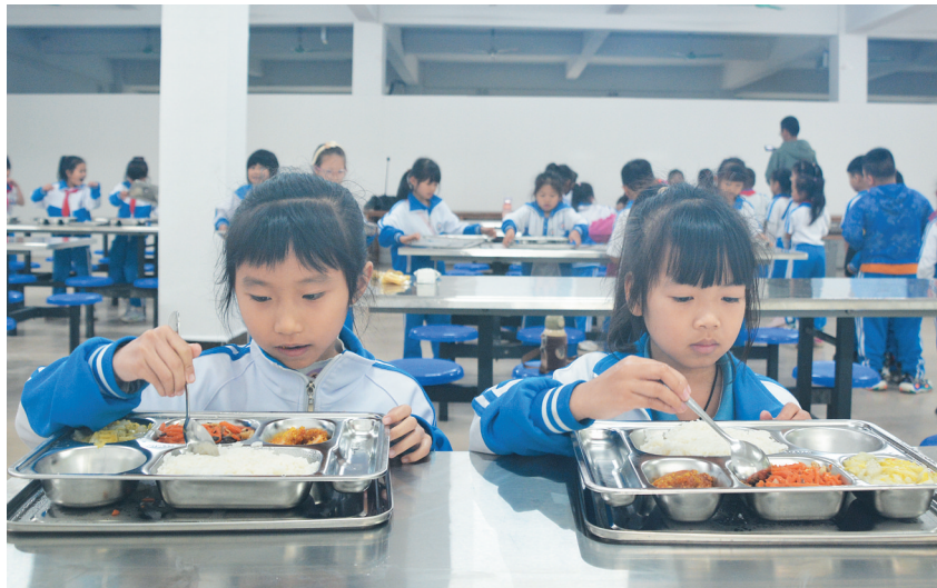
屯昌县水口中心小学的学生们正在校内吃午餐。

屯昌县教育局相关负责人表示,下一步,屯昌县将继续按照省教育厅要求,确保有需求的小学实现校内午餐全覆盖。