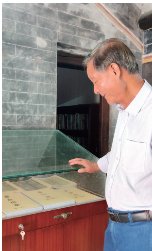
展示崖州民歌手抄本