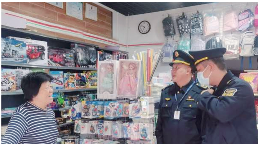
执法人员在校园周边文具店进行检查