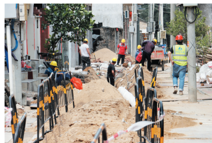
昌化镇污水管网建设现场。

南国都市报3月11日讯(记者程小丹)今年春节后,昌江全力推进全县污水管网项目建设,进一步提高水环境质量,让生态环境更美、人居环境更优。