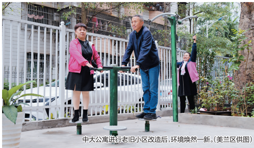
中大公寓进行老旧小区改造后,环境焕然一新。

去年,美兰区老旧小区改造项目共涉及92个小区,惠及8408户居民。美兰区相关负责人表示,今年计划改造25个老旧小区,惠及2113户居民。