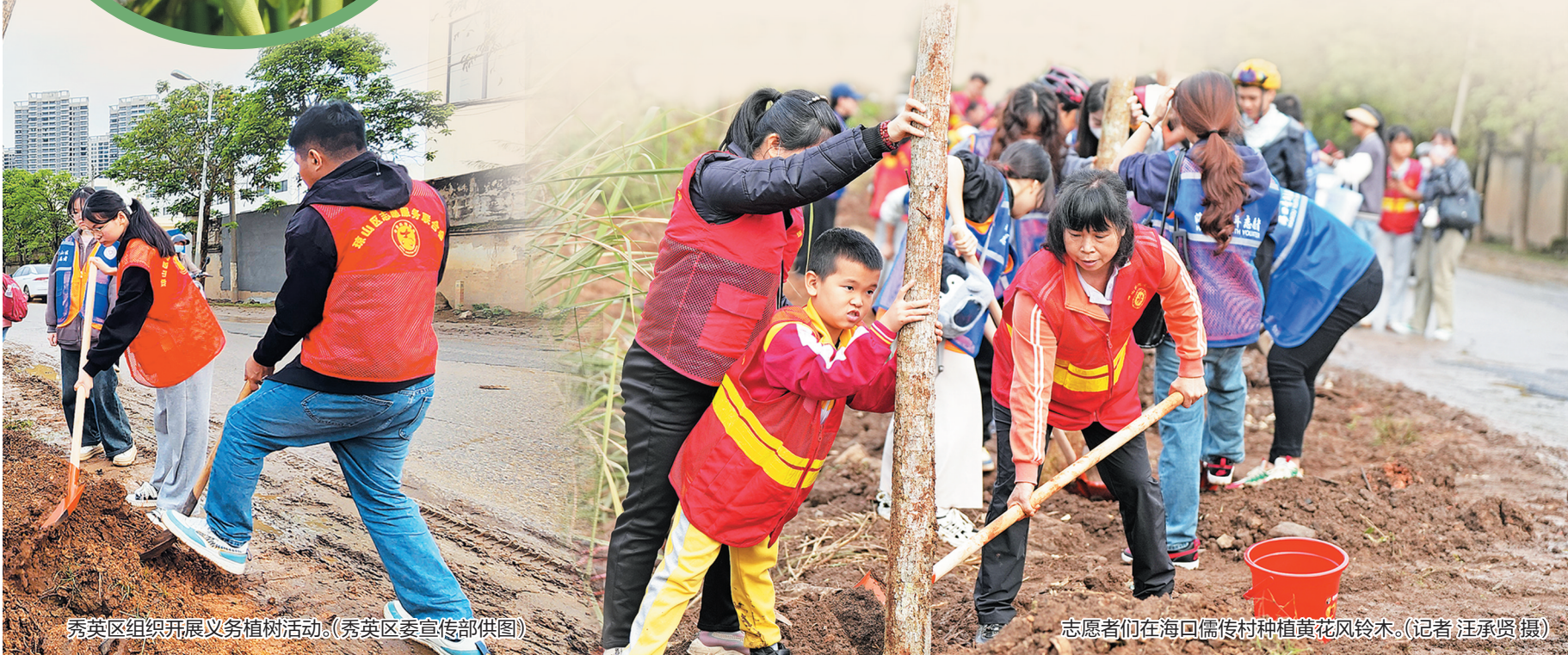
秀英区组织开展义务植树活动。

椰子、花梨、沉香、橡胶、槟榔、油茶等“六棵树”因其适应性强、经济效益和生态效益高,近年来成为全省造林绿化、园林绿化中的“主力军”,被各市县广泛推广种植。