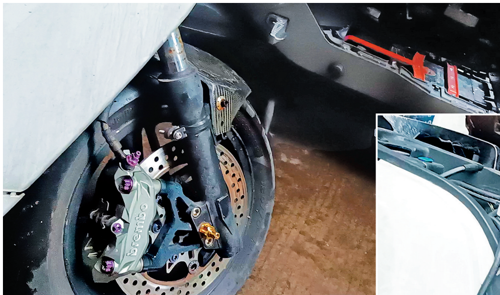
换电池、换电机……花费近5万元“魔改”的电动车。