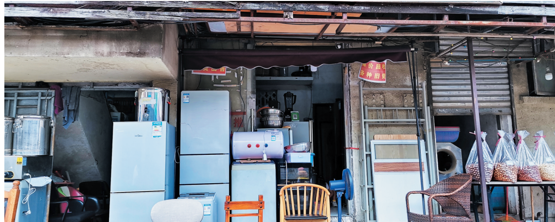
一家收购各类家具家电和办公用品的旧货回收店。

记者还发现,网络渠道的旧家电家具回收市场也同样比较“火”,在任一浏览器输入旧家具旧家电回收的字样,就会跳出一长串的各种回收公司的广告,且基本上都有联系电话,拨打过去向店家说明家具家电情况,预约上门看货、取货,很是方便。