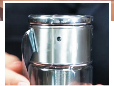
水杯上的针孔摄像头。

某等人藏匿于宜昌、荆州、随州、神农架等地的落脚酒店，但仍按兵不动。他们要在抓到犯罪嫌疑人的那一刻，固定涉案人员违法犯罪的证据。