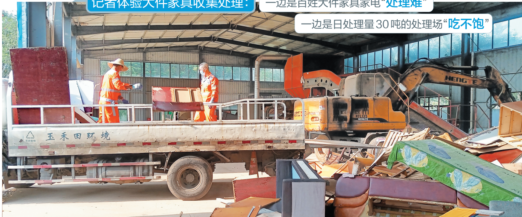
环卫工人将清运来的大件家具运入处理场。