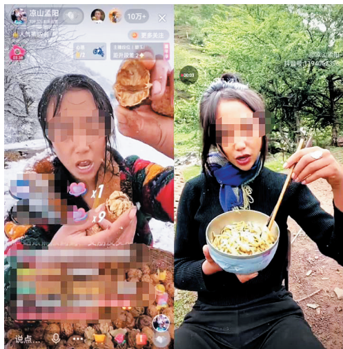
“凉山孟阳”直播视频截图。

定好的剧本摆拍“吸粉”,在短视频平台孵化出“凉山孟阳”和“凉山阿泽”两个“网红”账号,随后开始利用账号直播带货。