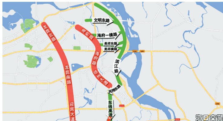
海府路→琼州大道、龙昆北路→龙昆南路→迎宾大道可绕行路线。