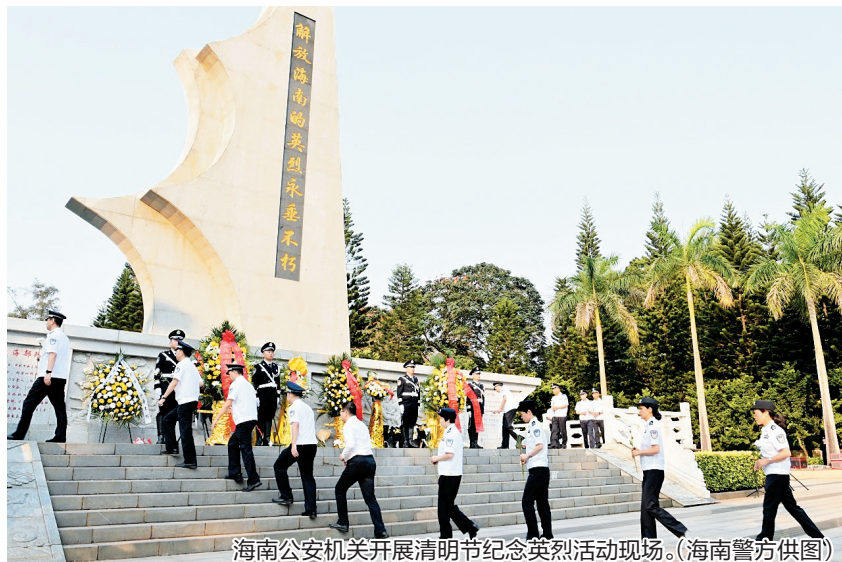
海南公安机关开展清明节纪念英烈活动现场。

南国都市报4月3日讯(记者 王燕珍 通讯员 李阳)在清明节到来之际,4月3日上午,海南省公安厅在海口市金牛岭“解放海南岛战役烈士陵园”隆重举行2024年“致敬公安英烈、激发奋进力量”清明节纪念英烈活动,深切缅怀革命先烈、寄托哀思。