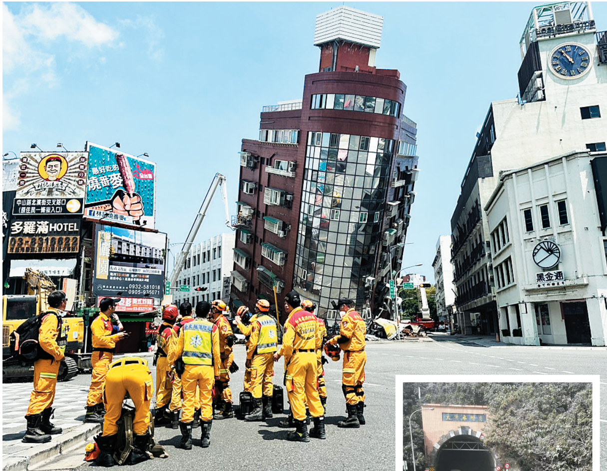
在花莲市,地震造成一栋大楼严重倾斜(4月3日摄)。

新华社驻台记者已从台北赶到花莲,展开现场采访,后续将跟进报道当地灾情及救灾情况。