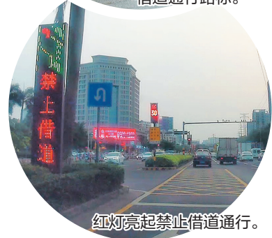
红灯亮起禁止借道通行。