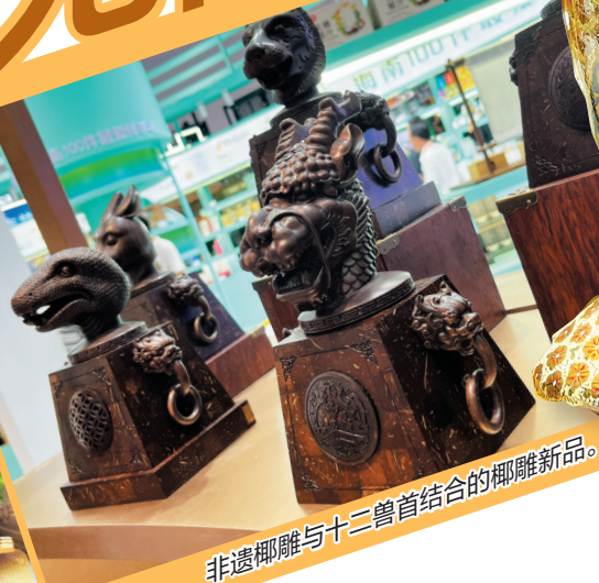
非遗椰雕与十二生肖结合的椰雕新品。