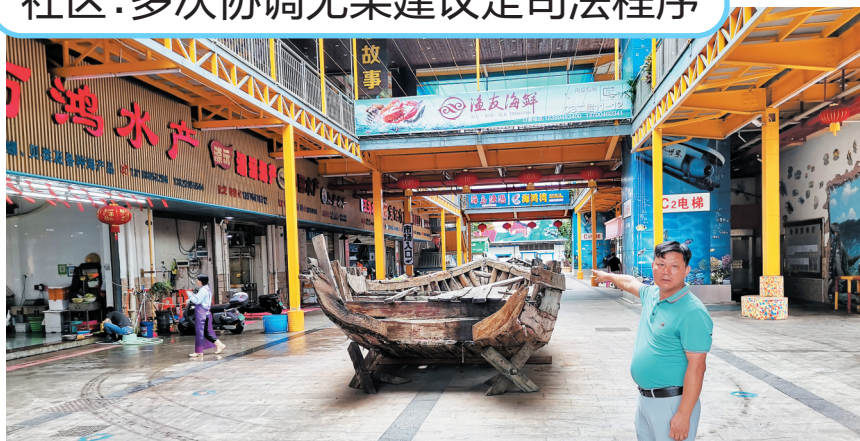
朱先生经营的餐饮店多次被罚。