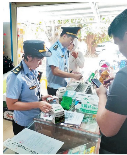
执法队员检查现场。

原来,标有“国药准字”号的风油精、创可贴属于药品,经营药品需要取得《药品经营许可证》,无证经营药品将依据《中华人民共和国药品管理法》相关规定给予行政处罚。消费者购买药品,需前往取得《药品经营许可证》的药店购买。