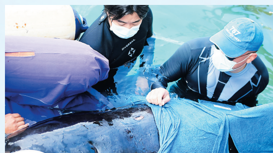
“海棠”身上有达摩鲨的咬痕。

“海棠”是一头亚成体短肢领航鲸。领航鲸是群居性的动物,“海棠”可能是与族群走散,又加上未成年,捕食能力弱,没有稳定的食物来源,受到达摩鲨的撕咬后,导致身体虚弱搁浅海棠湾,也可能是为了躲避达摩鲨撕咬导致搁浅。