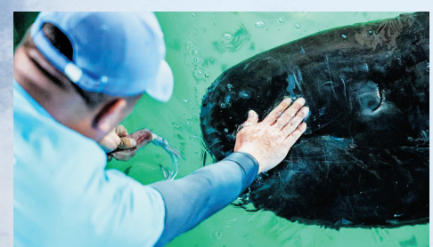
经过治疗,“海棠”明显好转。

救治“海棠”引起了全国各地海洋生物专家的关注,多方单位和企业的海洋生物专家赶赴现场对“海棠”进行会诊,外籍专家也在线对“海棠”救治进行了指导。