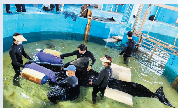
领航鲸转移到室内专业医疗救助池。