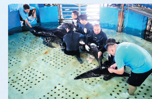
工作人员正在给领航鲸“海棠”抽血化验。

4月24日,在海南三亚海昌生物保育中心将领航鲸“海棠”引导进入医疗池中进行医疗体检。政府有关主管部门及专家对此次体检检测结果及其恢复情况进行评估,此次体检为“海棠”放生前准备工作之一。4月24日中午,在海南三亚海昌生物保育中心室内医疗池,工作人员对领航鲸“海棠”测量体长。经过112天的救治,领航鲸“海棠”体长由3.6米长到了3.7米,胸围从搁浅时的1.9米长到了2米。放生前,测量体长为3.96米。