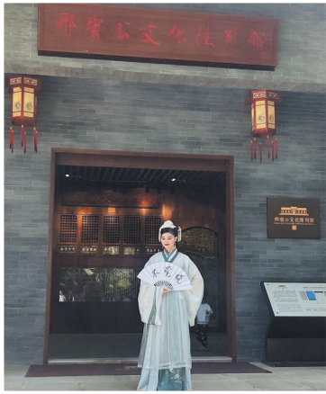
邢宥故居新建的门楼。