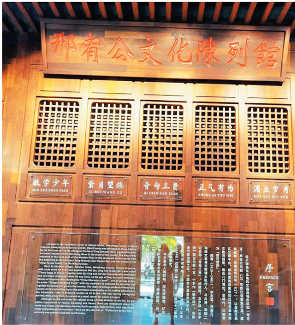
邢宥公文化陈列馆。