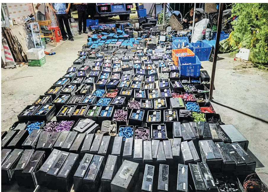
扣押的非法改装电池。

展联合执法15次,出动154人,检查维修销售点120家,立案查处非法改装电动自行车案件4起,罚款9万余元,全面加强电动自行车安全监管。三亚多部门