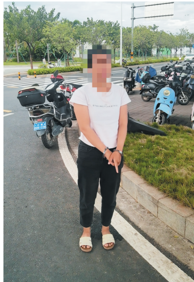
犯罪嫌疑人指认作案现场。

海口秀英警方提醒: 在公共场合停车,最好停在有人看管或有公共探头的地方,停车后一定记得拔掉钥匙锁好车,以免车辆丢失。