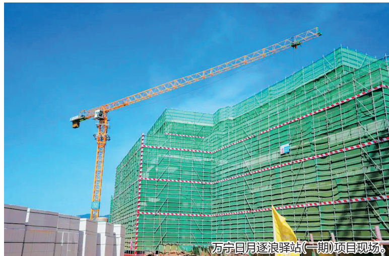
万宁日月逐浪驿站(一期)项目现场。

据了解,作为海南省政府建设的海南环岛旅游公路驿站的四个示范性驿站之一,万宁日月逐浪驿站项目占地155亩,总建筑面积39869平方米,项目巧妙融合体育运动、旅游休闲、餐饮娱乐等多元业态,规划建设人工冲浪池、冲浪主题酒店、艺术中心、商业配套等业态功能区,打造全国首个冲浪主题乐园。