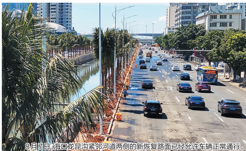
8月7日,海口龙昆沟紧邻河道两侧的新恢复路面已经允许车辆正常通行。