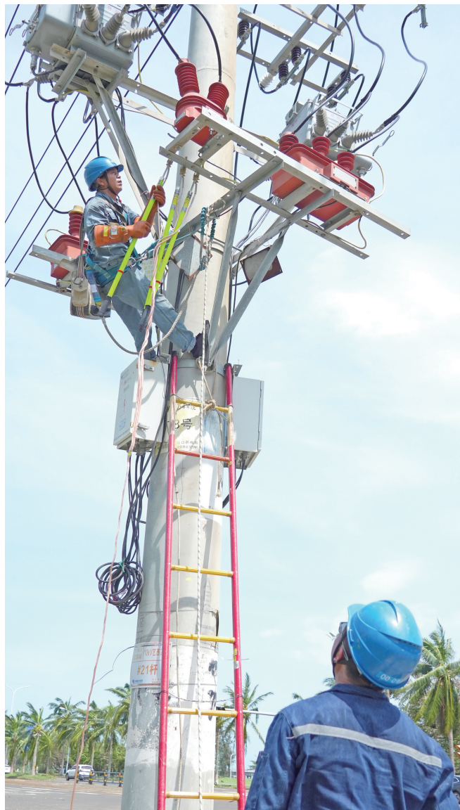
9月8日,南方电网公司广东电网援琼抢险队在西海岸投入电网抢修工作。

随着超强台风“摩羯”逐渐远离海南,抗击台风工作已全面转入灾后恢复重建阶段。武警战士、电力工人、铁路维修工人等人员争分夺秒,迅速展开各项抢修、重建工作,疏通道路、转移群众,处置各类突发情况,最大程度保护人民群众生命财产安全。 肆虐的台风远去,当风暴的怒吼平息,阳光再次穿透云层。风雨过后,他们便是最绚烂的彩虹。无论是紧急救援,还是灾后重建,他们一直在我们身边。