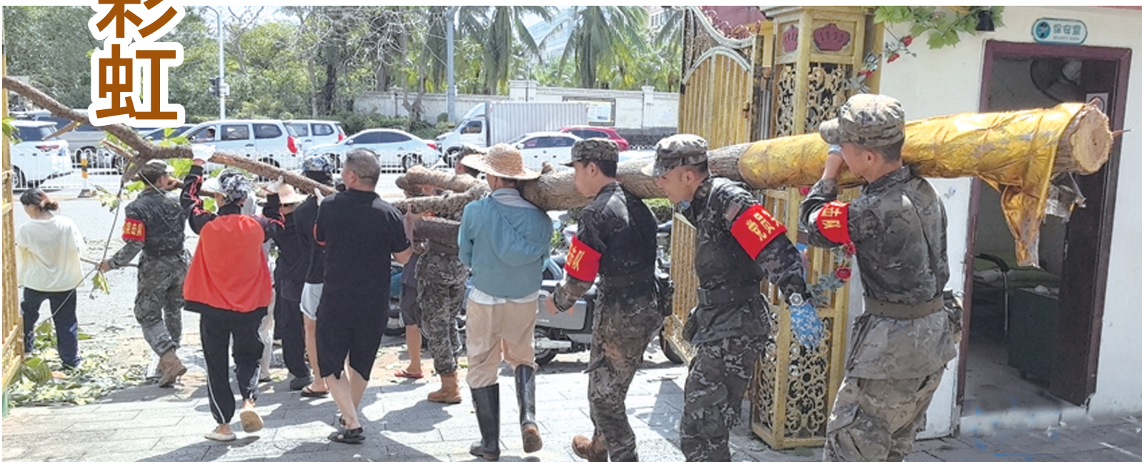
9月8日,武警海南总队机动支队官兵搬运倒伏的树木,连续奋战开展道路清障。