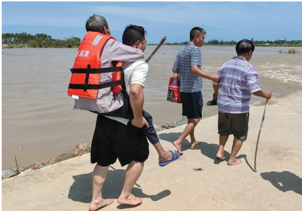
背的背,扶的扶,9月8日,东方四更镇党委和村两委干部组织人员护送村民安全返家。

随着超强台风“摩羯”逐渐远离海南,抗击台风工作已全面转入灾后恢复重建阶段。武警战士、电力工人、铁路维修工人等人员争分夺秒,迅速展开各项抢修、重建工作,疏通道路、转移群众,处置各类突发情况,最大程度保护人民群众生命财产安全。 肆虐的台风远去,当风暴的怒吼平息,阳光再次穿透云层。风雨过后,他们便是最绚烂的彩虹。无论是紧急救援,还是灾后重建,他们一直在我们身边。