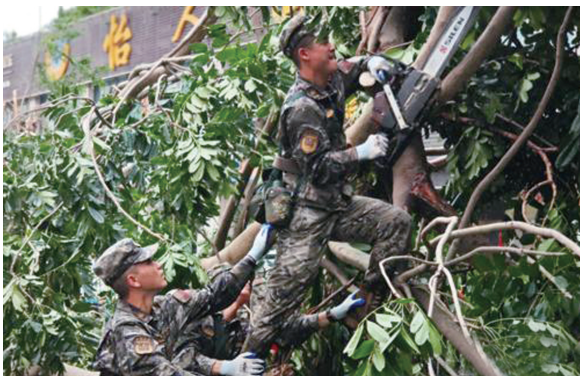
9月8日,武警海南总队机动支队1200余人奋战海口,担负美兰区、龙华区道路清障任务。