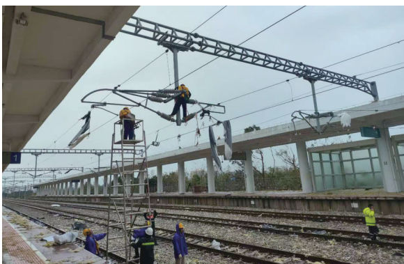
9月8日,海南铁路维修人员争分夺秒修复电力设施,保线路开通。