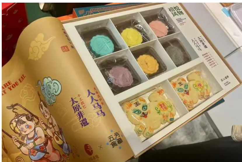
山西太原“天泰昌”老字号食品店铺的文创月饼糕点礼盒。

如今,人们的膳食结构日渐多样性,健康饮食的理念深入人心,消费群体对月饼的选购也更加看重馅料的营养和糖油比例。在电商和直播平台,低糖、低脂、低卡路里等关键词的月饼品类明显增多。有的医院和药铺也加入月饼“赛道”。由传统中药材成分制作的月饼,在中秋节迅速走红。老字号品牌同仁堂推出一款特别的月饼礼盒,里面含有一些传统中药材成分,如当归、黄芪、石斛等。