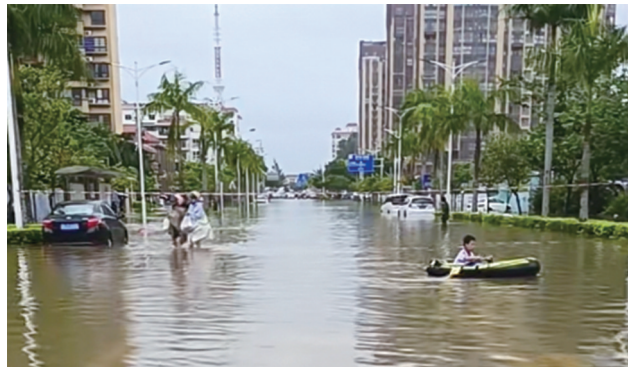
街道被淹,有市民划船出行。

南国都市报9月20日讯(记者 苏桂除 文/图)多条高速公路、省道县道等交通中断,主城区主要交通要道受阻,中小学幼儿园停课,市民“划船”出行……9月19日,受台风“苏力”影响,琼海长时间强降雨,导致琼海市嘉积镇大半座城被水淹,12个乡镇降雨量超过200毫米。这场降雨为何这么大,暴雨过后,相关部门又采取了哪些紧急措施排涝?记者就此进行了采访。