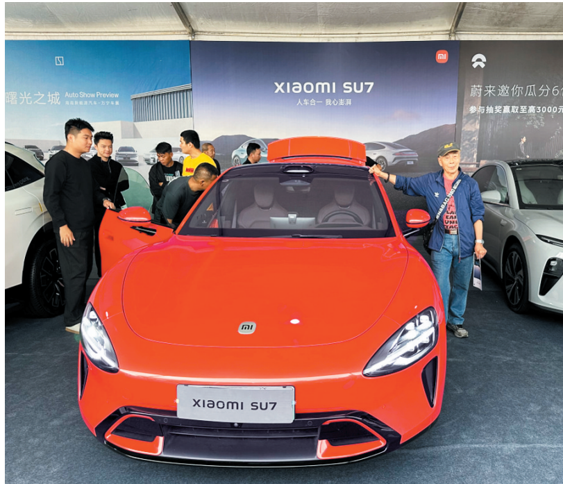
新能源汽车下乡暨万宁车展活动,消费者体验小米su7。

为了加大以旧换新工作力度,万宁出台《2024年万宁市促进推动消费品以及换新实施方案》,活跃该市汽车、家电消费市场;同时积极组织相关企业开展多样式促销活动,激发消费者购买欲望,促进了该市消费市场繁荣发展,6-8月分别在万城镇以及兴隆区举办万宁以旧换新惠民美食展活动,通过现场购物送钜惠大礼包,免费赠送美食优惠券,银行低息贷款并赠送商超购物卡,抖音现场直播等方式提高以旧换新优惠