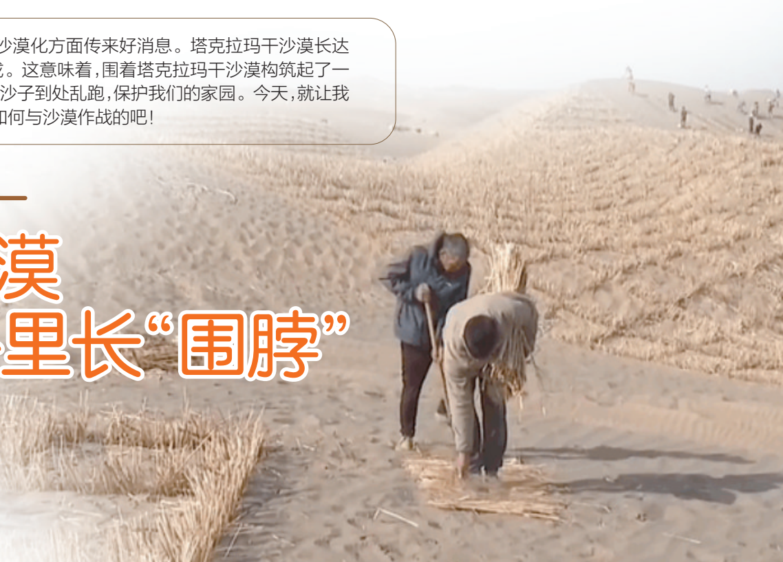
村民铺设草方格,用来阻挡流沙的扩散。

光伏治沙:这个方法就是在沙漠里“种太阳”。人们在沙漠里安装了很多太阳能光伏板,这些光伏板不仅可以发电,还可以降低地表风速,减少风蚀作用,稳定沙土。光伏板下的土地还可以种植耐旱植物或作物,用根系固定沙土,实现了发电、农业增收、治沙三合一。