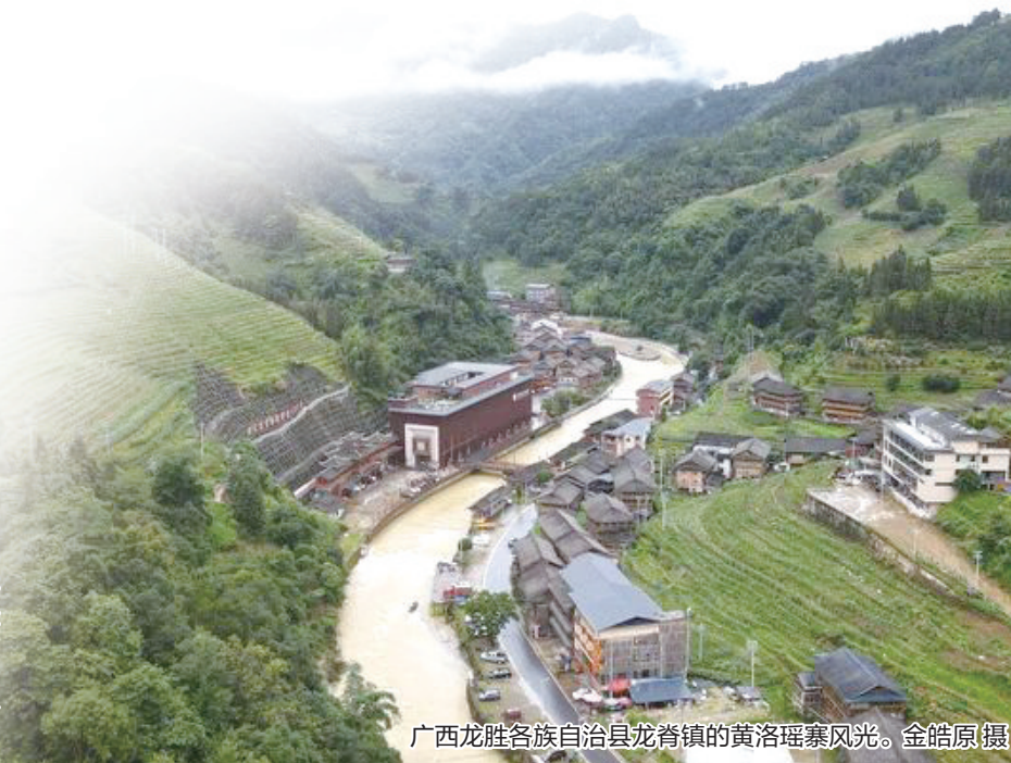
广西龙胜各族自治县龙脊镇的黄洛瑶寨风光。