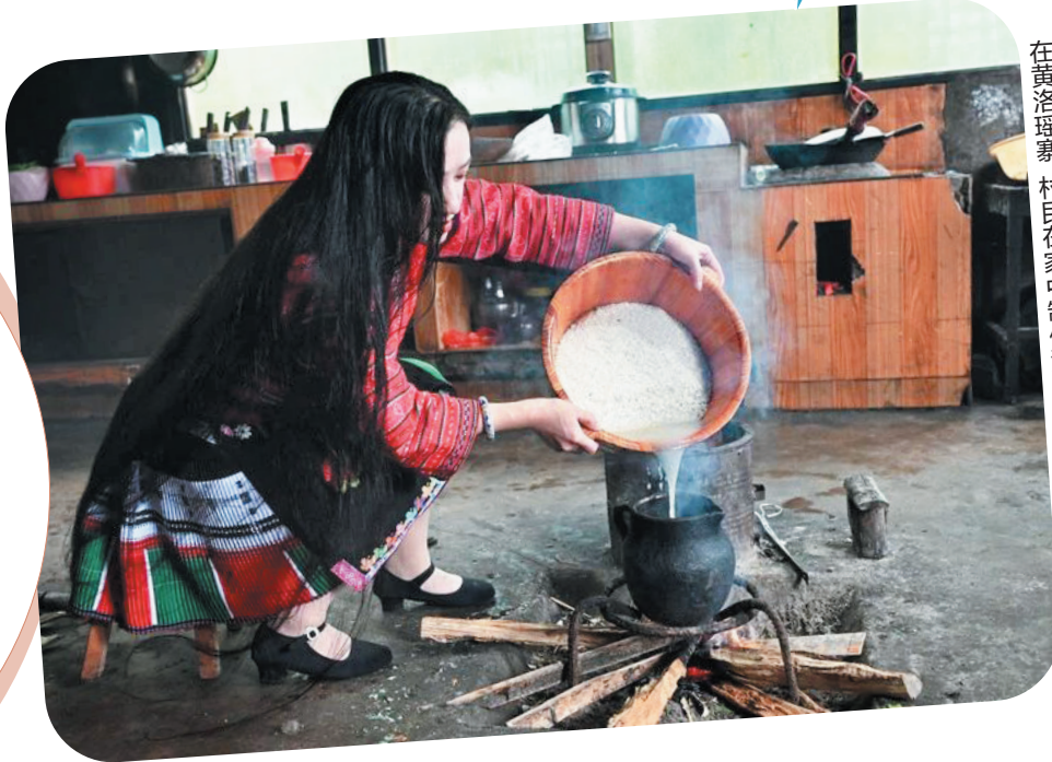
在黄洛瑶寨，村民在家中制作洗发用的淘米水。

嘿，小朋友们！你们有没有想过，长发可以有多长？在中国广西的一个美丽村寨里，住着一群特别的女性，她们有着长长的头发和漂亮的传统服饰。这个村寨叫做黄洛瑶寨，被誉为“天下第一长发村”。今天，就让我们一起走进这个充满魔法般长发和传统服饰的地方，了解她们的故事吧！