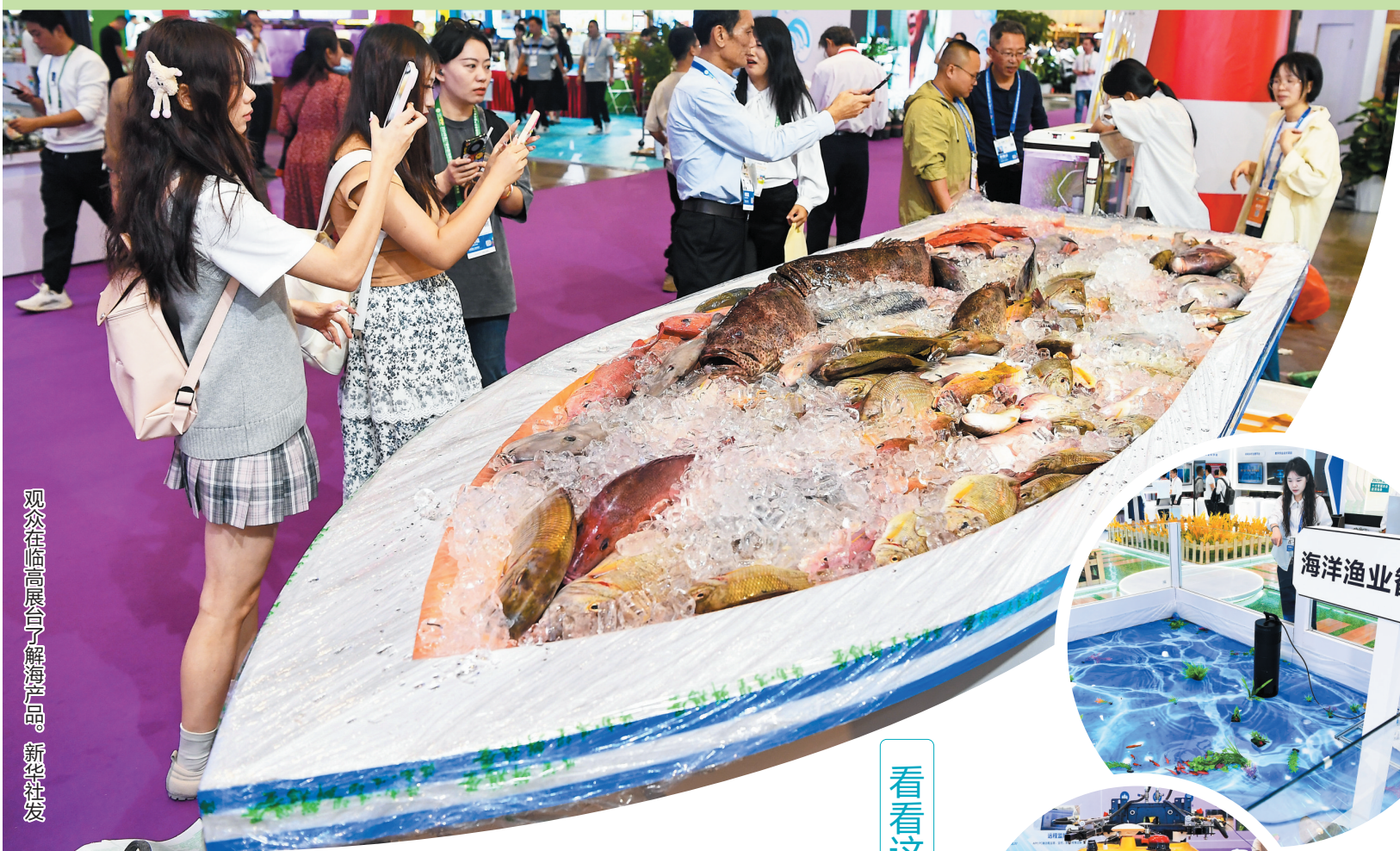
观众在临高展台了解海产品。