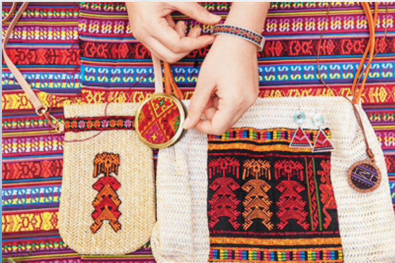
具有时尚气息的黎锦。