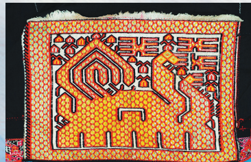
黎锦动物纹。