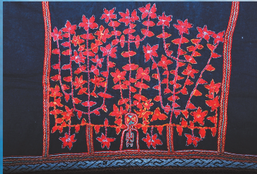
黎锦植物纹。(图据海南日报)