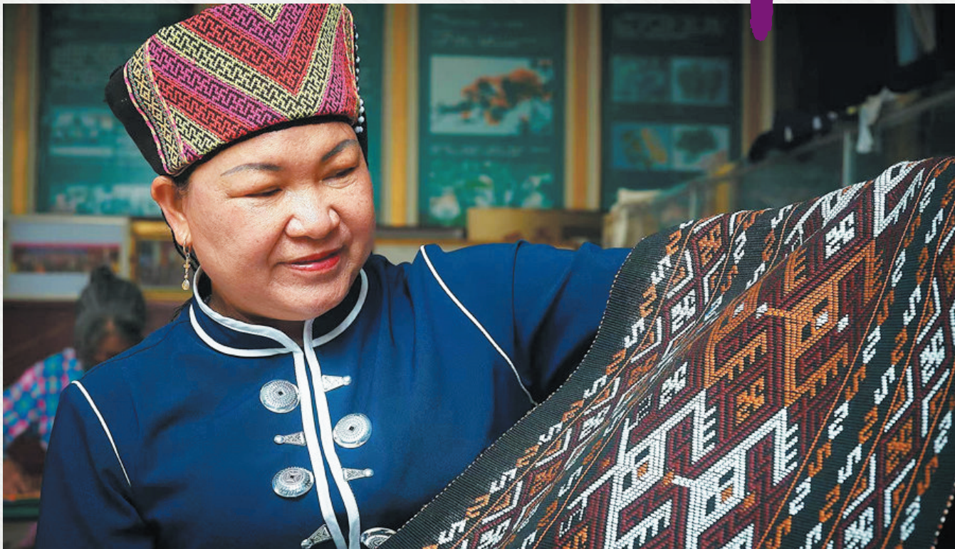
黎锦技艺传承人正在展示黎锦。