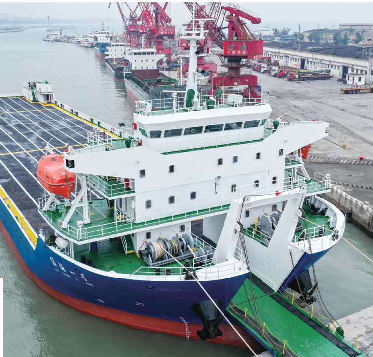
新能源汽车专用运输平板船“绿源一号”即将投入运营。