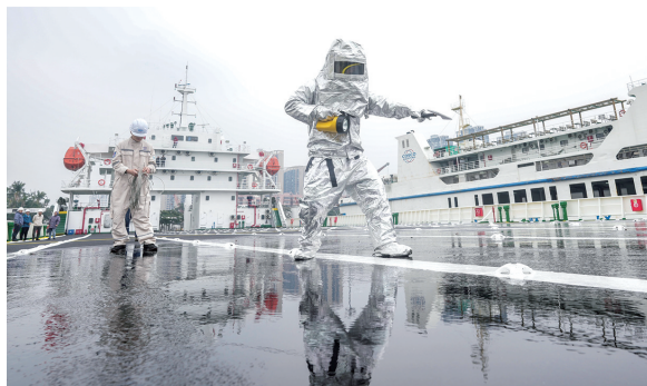
应急演练。