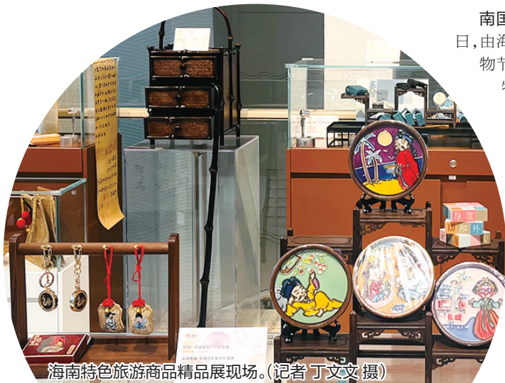
海南特色旅游商品精品展现场。

南国都市报12月28日讯(记者 丁文文)12月27日,由海南省旅文厅主办的第二届海南旅游商品好物节系列活动之一“琼派古今 珍集荟萃”海南特色旅游商品精品展在海南省博物馆开幕。该展览将在海南省博物馆历史馆三楼长期对公众开展展销,为市民游客提供一个深入了解和体验海南旅游文化的平台。