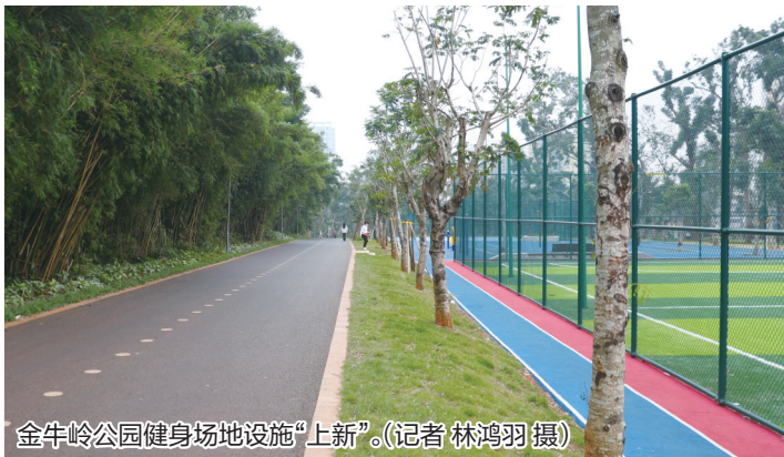
金牛岭公园健身场地设施“上新”。