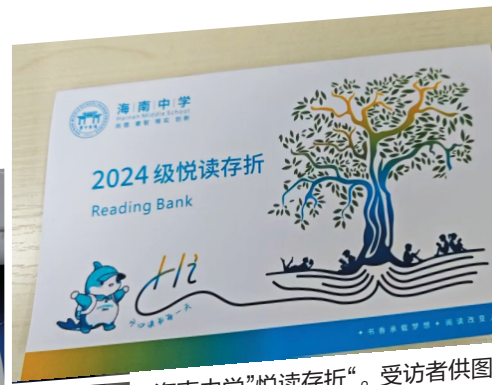
海南中学“悦读存折”。