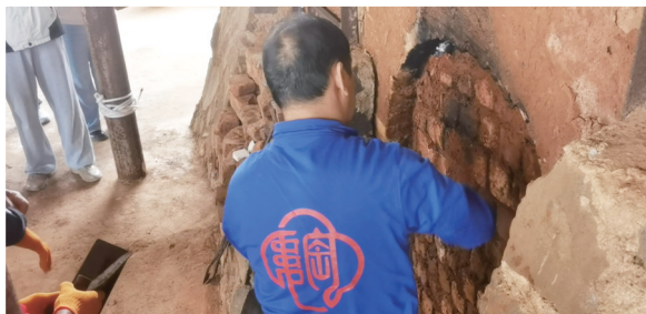
◀工作人员正准备开窑。 ▼出窑的器物。

此次开窑节的成功举办,不仅是对福安窑制陶和柴烧技艺的又一次精彩展示,更是对陶器文化的有力传承和弘扬。目前,澄迈县提出建设“四个澄迈”(青年澄迈、文化澄迈、数智澄迈、幸福澄迈),其中,以福安古窑为代表的传统文化正在为当地文化产业发展注入新的活力,在保持古法柴烧核心技艺基础上,该县也将农文旅融合发展的思路融入陶器文化的发展之中。