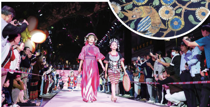
(小图)2022年4月20日,博鳌亚洲论坛主题公园展出的黎锦被。(大图)3月30日,市民观看“村秀”表演。