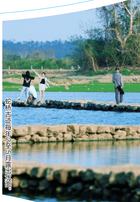
蛇桥古迹每年2月至5月露出水面。