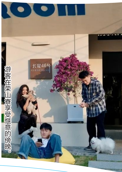
游客在荣山寮享受惬意的傍晚。