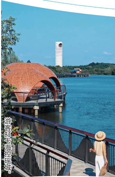
游客打卡海控瑶城。