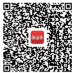
扫码了解 秀英区活动