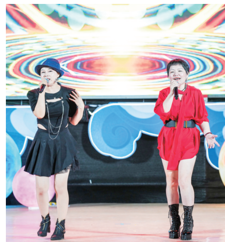
龙楼音乐派对活动现场。

南国都市报6月22日讯(记者 程小丹)6月22日晚,由文昌市龙楼镇人民政府主办的海南“村VA”系列活动之“日落声起CHILL追光”龙楼音乐派对在文昌铜鼓岭旅游区奏响,现场超燃的曲目让市民游客开启别样的夏夜狂欢。