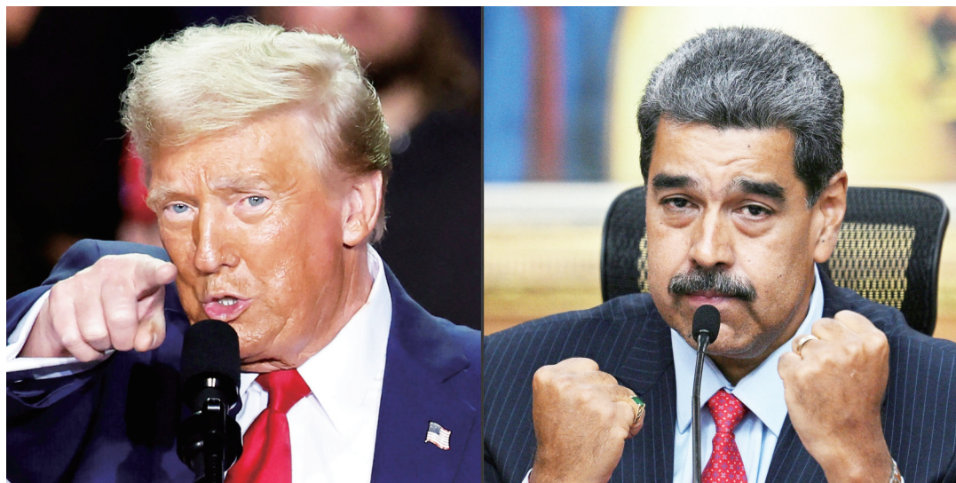
特朗普(左)和马杜罗。(拼版照片,新华社/法新)

当地时间3日凌晨2时左右,夜色中的委内瑞拉首都加拉加斯传出爆炸声,火光闪现,浓烟升腾,人们从睡梦中惊醒。三个多小时后,美国总统特朗普宣布已经“抓获”委总统马杜罗及其夫人,并用飞机带离委内瑞拉。