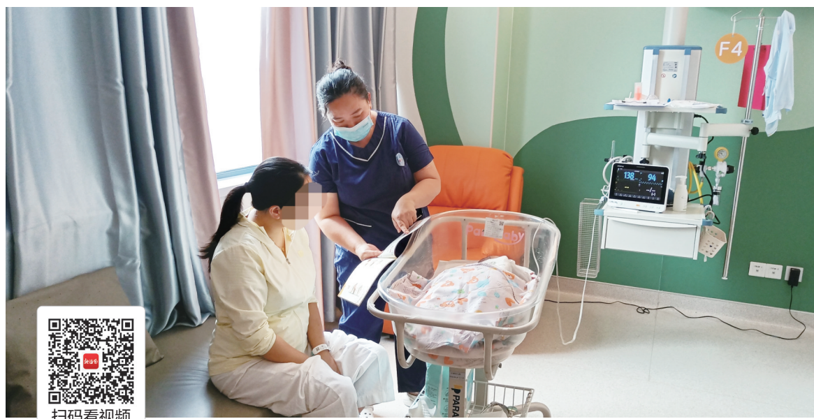
在省妇女儿童医学中心,医护人员对宝妈进行政策指导。