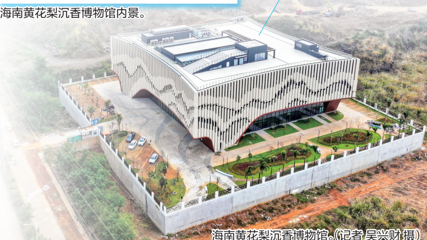
海南黄花梨沉香博物馆。(记者吴兴财摄)