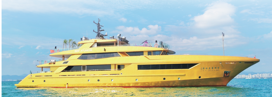
“亚特兰蒂斯号”入驻三亚。

南国都市报1月14日讯(记者 沙晓峰 通讯员 甘婷)1月14日,记者从三亚海事局获悉,中国最大的钢质入级游艇“亚特兰蒂斯号”近日入驻三亚,三亚海事局为“亚特兰蒂斯号”游艇颁发船舶所有权登记证书与船舶国籍证书。“亚特兰蒂斯号”游艇总长52米,型宽10.5米,型深4.6米,总吨位达719吨。该游艇的落户,不仅刷新了海南省大型游艇纪录,也进一步丰富了三亚游艇业态。据统计,截至2025年底,三亚累计登记游艇1403艘。