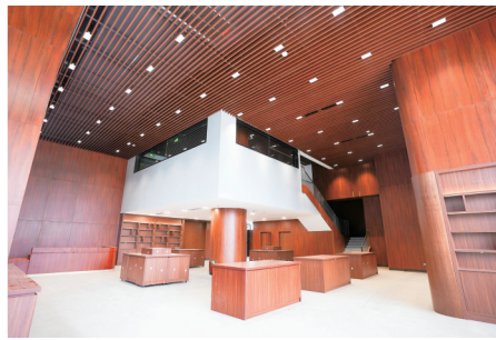
海南黄花梨沉香博物馆内景。

此次海南省黄花梨沉香博物馆主体工程的顺利竣工,不仅丰富了海南“1+4+N”博物馆体系内涵,更将以文化赋能文旅融合为自贸港建设注入动力。